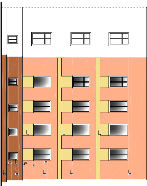
ELEWACJA POŁUDNIOWA skala 1:200